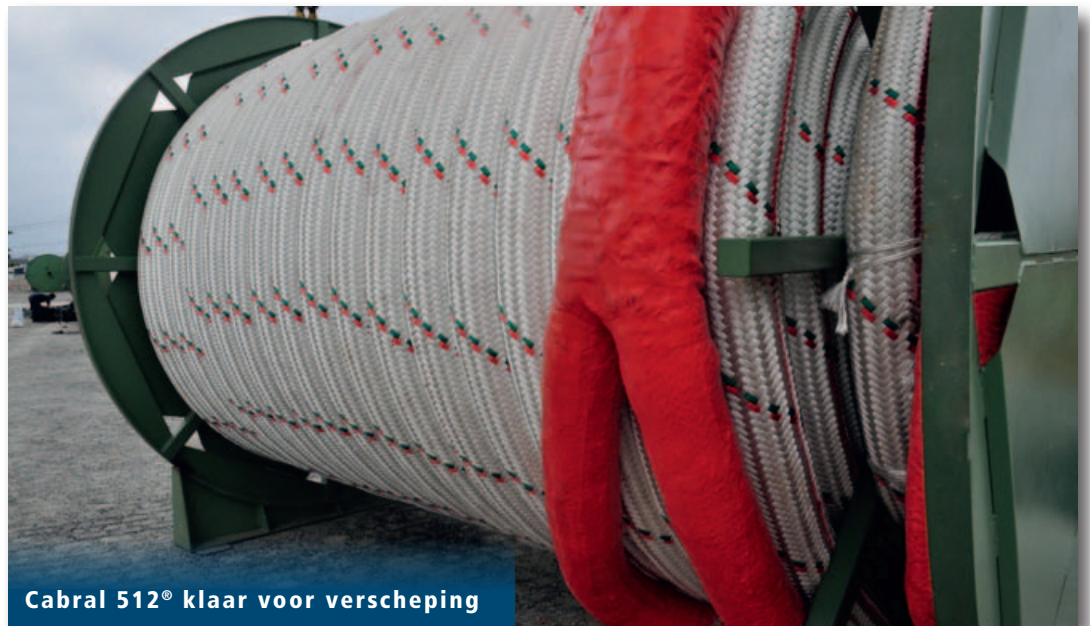
Cabral 512® klaar voor verschepping

Lankhorst Euronete Brasil is een onderdeel van WireCo® World-Group en gespecialiseerd in het ontwikkelen en produceren van touwen voor de maritieme en offshore-industrie en toonaangevend leverancier in vele scheepvaart- en offshoremarkten over de hele wereld.