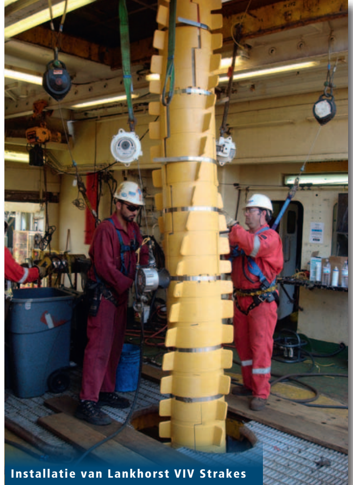
Installatie van Lankhorst VIV Strakes

milieu en passen daarmee in een duurzame omgeving. We focussen op het reduceren en recycleren van afval, het minimaliseren van benodigde input en het maken van meerjarenafspraken met de overheid over energiereductie. En ook onze interne werkplaats van de sociale werkvoorziening Empatec is inmiddels niet meer van ons terrein weg te denken. Hier maken ze standaard producten voor de klant op maat. Daar zijn wij trots op!