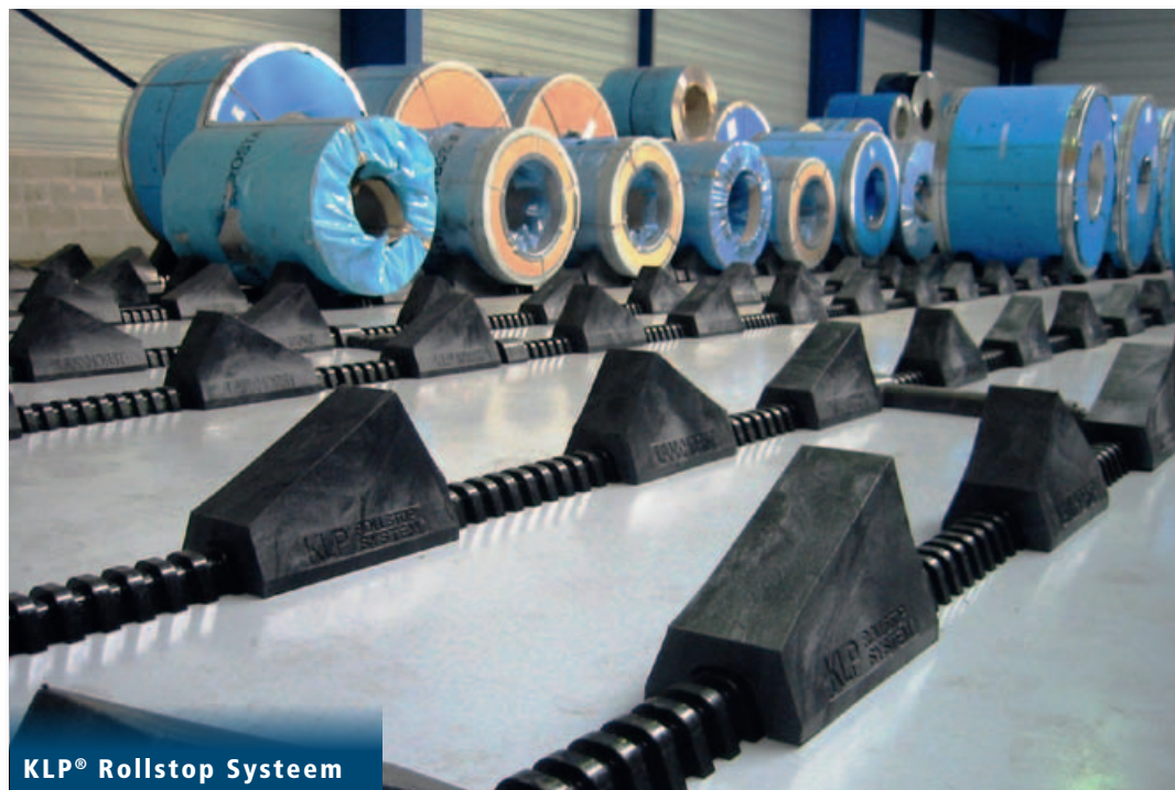
KLP® Rollstop System