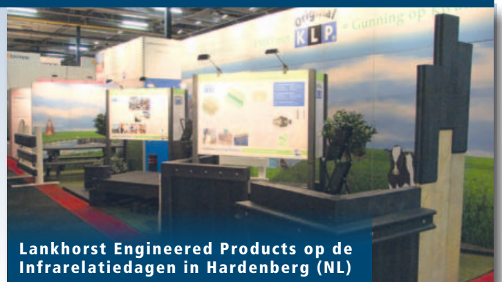
Lankhorst Engineered Products op de Infrarelatiedagen in Hardenberg (NL)