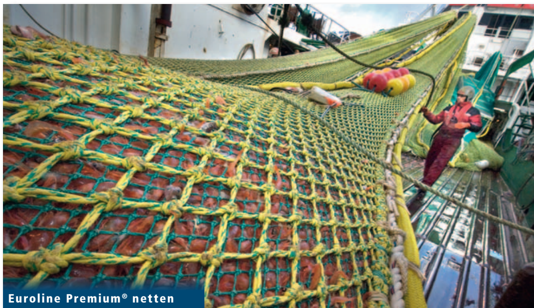
Euroline Premium® netten

En 'last but not least', willen we graag stilstaan bij de zeer gewaardeerde bijdrage van zowel onze werknemers als klanten die we veel dank verschuldigd zijn. Tenslotte zijn zij de reden van ons succes!