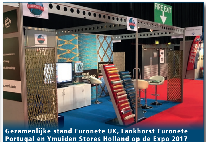
Gezamenlijke stand Euronete UK, Lankhorst Euronete Portugal en Ymuiden Stores Holland op de Expo 2017