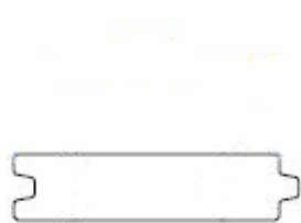
Doorsnede KLP ® Veer & Groef plank